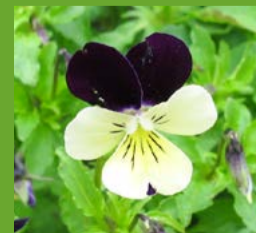
Viola di campo