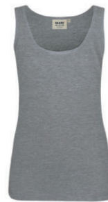
015 gris chiné